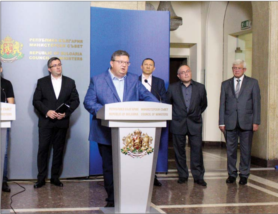
Главният прокурор Сотир Цацаров съобщава подробности от разследването.

Той уточни, че пътят през Искърското дефиле има технически паспорт, издаден през февруари 2017 г., а дейно-