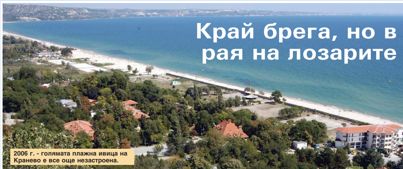
2006 г. - голямата плажна ивица на Кранево е все още незастроена.

Тук туристите ще открият 4 обособени зони, осигуряващи им различни видове усещания и активности. Водната зона предлага вътрешни и външни басейни с минерална вода, 25-метров плувен басейн, зона за плаж, външна сауна с панорамна гледка към морето и контрастен басейн. Детската зона разполага с 4 огледално разположени вътрешни и външни басейни с минерална вода, като два от тях са предвидени за бебета. (24 часа)