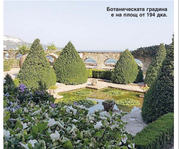
Ботаническата градина е на площ от 194 дка.

мите на българският болярин Балик, наречени по-късно на неговото име.