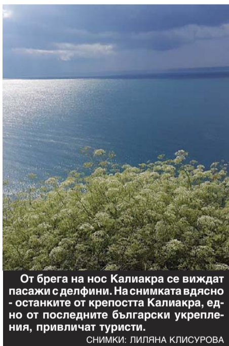
От брега на нос Калиакра се виждат пасажии с делфини. На снимката вдясно - останките от крепостта Калиакра, едно от последните български укрепления, привличат туристи.

Още при входа в курорта колата на всеки пристигащ се дезинфекцира, а температурата на гостите на хотелите се измерва. На двойна дезинфекция подлежат хотелските ресторанти, коридори и лобита. Заради мерки за сигурност са подготвени специални карантинни стаи. На всички подходи към плажните сектори вече са поставени специални диспенсери за дезинфекция. Въпреки условията на пандемия и тази година комплексът очаква своите гости. (24 часа)