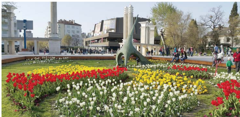
Входът на Морската градина - в нея се засаждат хиляди стръкове сезонни цветя.

Дворецът е известен и с винарската си изба, създадена от автора на първия учебник по винарство у нас.