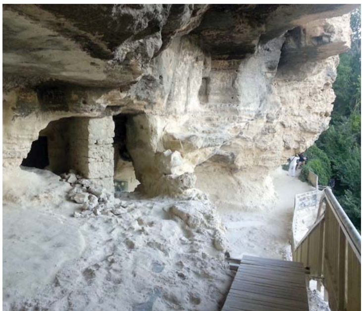
Аладжа манастир е една от забележителностите наоколо. Според предание патронът на обителта е свети Спас.

Съвременното име на курорта се свързва със стара легенда, която разказва за пирати, които закопали златно съкровище по крайбрежието северно от Варна. Земята им отмъстила, като превърнала златото в прекрасен пясък. (24 часа)