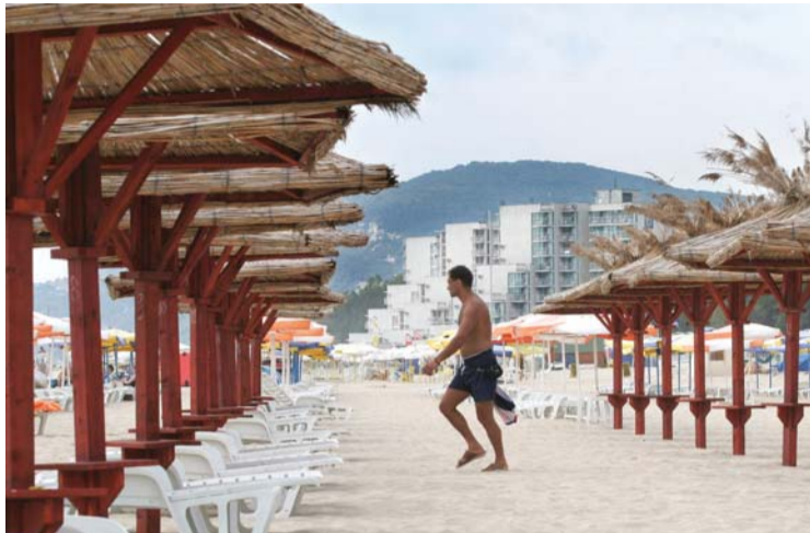
През годините курортът запази своя семеен характер.

Сред световноизвестните личности, посетили комплекса, са кубинският лидер Фидел Кастро, президентът на Австрия Бруно Крайски, Ким Ир Сен - генерален секретар на Кореиската социалистическа партия, космонавтите Георги Иванов и Николай Руквишников, режисьорът Ни-