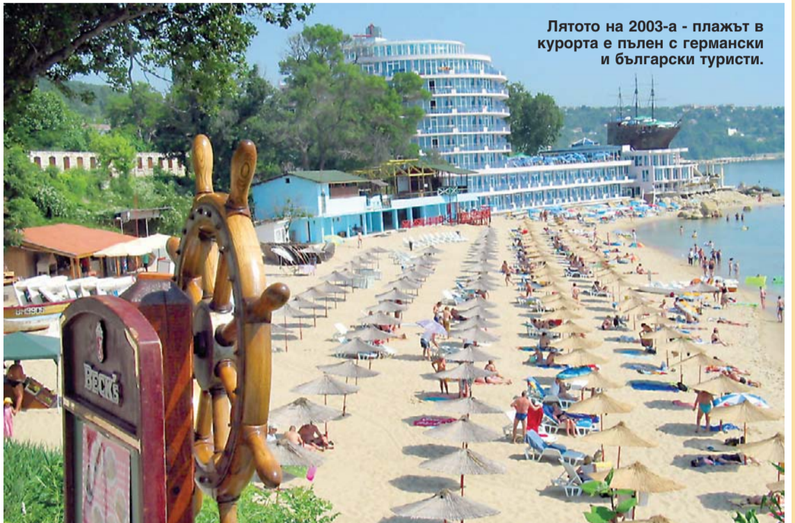
Лятото на 2003-а - плажът в курорта е пълен с германски и български туристи.

През 1955 г. започва и истинското разрастване на курорта, наречен по-късно Дружба. Изградени са редица хотели, ресторанти, спортни съоръжения. Разбира се, създадено е и местенце за почивка на важни гости. Това е хотел, в който отседат български и чуждестранни управници, световноизвестни актьо-