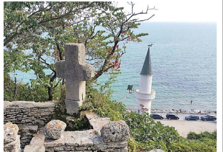
Дворецът на румънската кралица Мария е задължителната спирка на хилядите туристи.

До Балчик има 2 къмпинга - „Сандрино“ и „Бели бряг“.